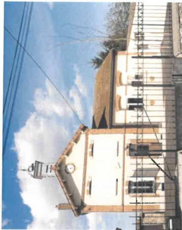
Ecole primaire des Montils – La Chapelle-Rablais

Les déchets sont collectés, au rythme d'un ramassage par semaine pour les déchets ménagers et un ramassage tous les quinze jours pour les emballages recyclables, par le SIRMOTOM dont le siège est situé sur la commune de Montereau. Un ramassage spécifique pour la collecte des encombrants est réalisé quatre fois dans l'année. Les habitants ont également accès à la déchèterie de Nangis.